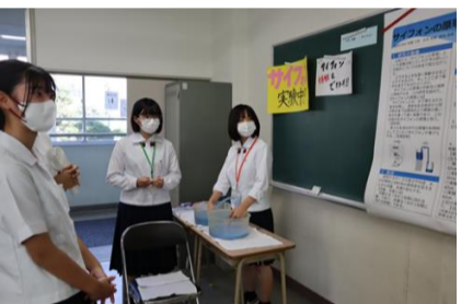
クラス発表の様子 2年