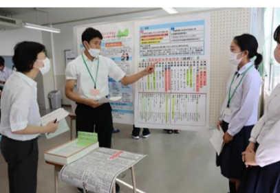
「富高版 富山弁番付表」を作ってみた～

ポスターセッション 研究発表などの形式のひとつで、発表者が研究内容をポスターにまとめて掲示し、参加者に説明するもの。参加者と直接、意見交換ができる。