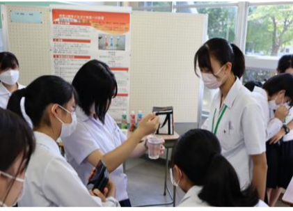
クラス発表の様子 1年

12月18日の三校合同研究発表会に向け更に内容を検討し、中身のあるものにするため職員と協力していきます。また自信を持って発表できるように練習を重ねていきます。