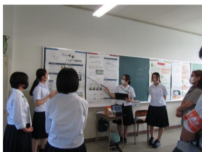
イチから始める豆苗生活