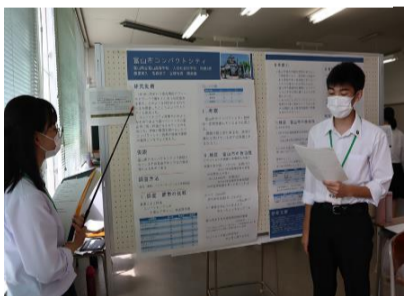
富山市コンパクトシティ