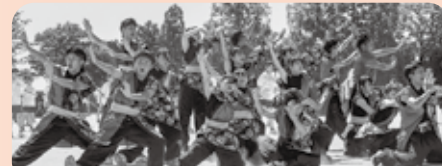
体育大会(応援合戦)