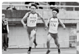
高校総体(陸上競技部)