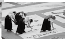
文化活動発表会(書道部)